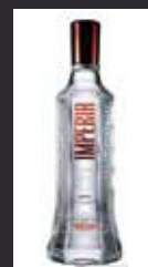
IMPERIA 11,50 €