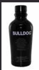
BULLDOG 11,00 €