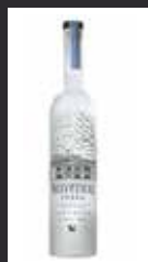
BELVEDERE 10,00 €