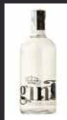
GINSELF 11,50 €