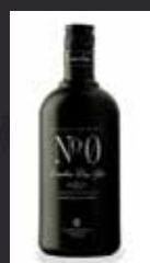
LONDON N° 0 11,50 €