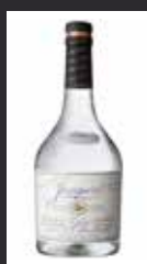
JUNIPERO 12,50 €