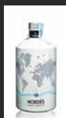
NORDÉS 11,00 €