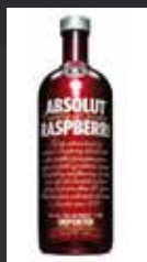
ABSOLUT RASPBERRI 7,00 €