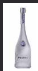
VODKA PRAVDA 8,00 €