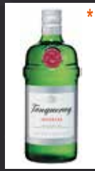
TANQUERAY 7,50 €

40% INGLATERRA Una de sus características más destacadas su tradicional proceso "single-fold", que no añade ningún tipo de concentrado o aditivo tras la destilación. El resultado del destilado va directamente a la botella, donde únicamente se mezcla con el agua más pura para rebajar la graduación del alcohol. Además, este genuino proceso de elaboración se sigue realizando en el alambique de cobre original, que data de 1831. El sabor de 'Bombay Original' es el de una ginebra clásica, ligeramente seca y con un sutil acabado a enebro. Se obtiene por destilación de la cebada sin maltear, rectificado con bayas de enebro y aromatizado con cardamomo, angélica y otras hierbas que le dan su fragancia y aroma característico (corteza de cassia, lirio, cáscara