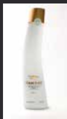
MAMONT 11,50 €