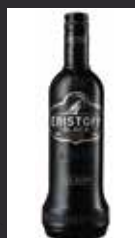
ERISTOFF BLACK 6,00 €