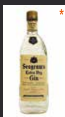
SEAGRAM'S 6,50 €