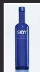
SKYY 7,00 €