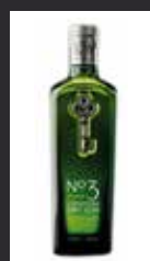
LONDON N° 3 12,00 €