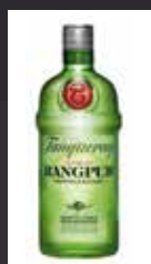
TANQUERAY RANGPUR 11,00 €