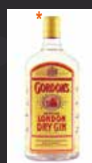
GORDON'S 6,50 €