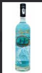
MAGELLAN 11,50 €