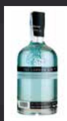
LONDON Nº 1 11,50 €