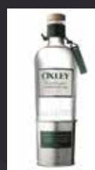
OXLEY 15,00 €