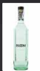
BLOOM 11,50 €