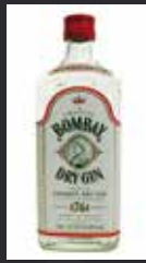
BOMBAY 6,50 €