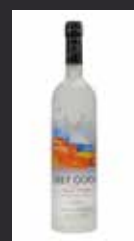
GREY GOOSE L'ORANGE 11,50 €