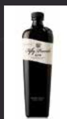
FIFTY POUNDS 11,00 €