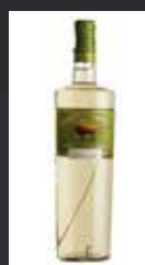
ZUBROWKA 7,00 €