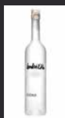
BABICKA 7,50 €