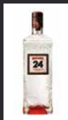
BEEFEATER 24 11,00 €