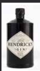
HENDRICK'S 11,50 €