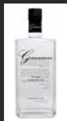
GERANIUM 11,00 €