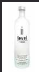
LEVEL OF ABSOLUT 11,00 €

40% HOLANDA Se elabora con trigo de primera calidad y agua muy neutra. Para afinar su sabor, se somete a una quintuple destilación para eliminar el máximo porcentaje de impurezas, consiguiendo un producto muy fino.