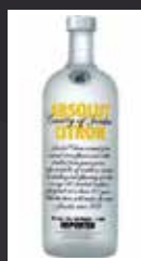
ABSOLUT CITRON 7,00 €