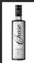
CHASE 11,50 €