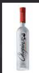
CHOPIN POTATO 13,50 €

40% POLONIA Producido por cinco destilaciones, por lotes, de granos de centeno, con agua de los Cárpatos y filtrado en carbón activado. Es suave, encantador, exclusivo, poco dulce y aterciopelado paso por el paladar.