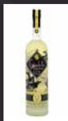
CITADELLE RESERVE 15,00 €

44% ESCOCIA Ginebra elaborada de forma totalmente artesanal siguiendo su vieja tradición. Su nota verdaderamente característica y genuina, es la adición durante la destilación de infusión de Rosas de Bulgaria y de Pepino.