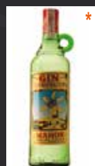
XORIGUER 6,50 €

49,3% U.S.A. CALIFORNIA. Aunque su fórmula de destilación se mantiene en secreto, se ha creado una excelente ginebra que sin ser excesivamente aromática, se perciben notas especiadas, de enebro, cítricos, como naranja y limón, hierba recién cortada, hinojo.