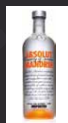
ABSOLUT MANDRIN 7,00 €