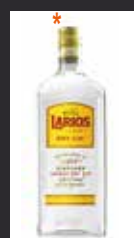
LARIOS 6,50 €