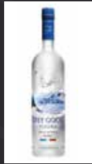
GREY GOOSE 11,50 €

40% ESPAÑA Vodka elaborado mediante cinco destilaciones en el Puerto de Santa María. Se produce con agua purificada en ósmosis inversa y filtrado con cristal de kieselguhr. Sabor suave, envolvente y final refrescante con toques ligeramente dulces.