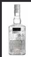
MARTIN MILLER'S WESTBOURNE 11,50 €