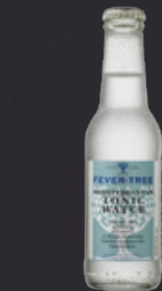
FEVER TREE MEDITERRANEAN