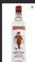
BEEFEATER 7,00 €