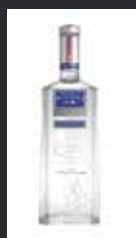
MARTIN MILLER'S 11,00 €