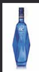
CITADELLE 6C 7,50 €