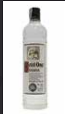
KETEL ONE 10,00 €