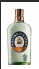
PLYMOUTH 11,00 €