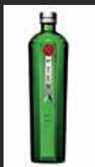
TANQUERAY TEN 11,00 €