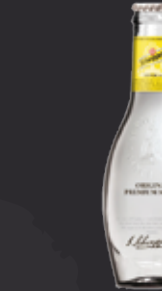
SCHWEPPE'S ORIGINAL PREMIUM