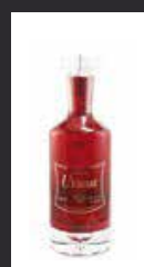
ULTIMAT CEREZA 10,00 €