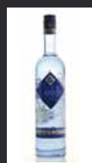
CITADELLE 11,00 €