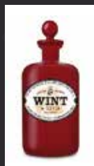
WINT & LILA 11,50 €