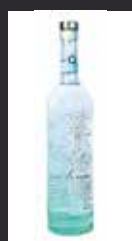
SIKU 7,50 €