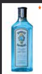
BOMBAY SAPPHIRE 7,50 €