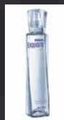
WIBOROWA ESQUISITE 11,50 €