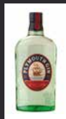
PLYMOUTH NAVY STRENGTH 11,00 €