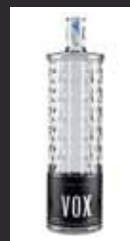
VODKA VOX 10,00 €