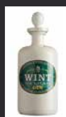
WINT 10,00 €