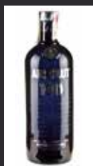
ABSOLUT 100 BLACK 11,00 €