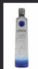
CIROC 11,00 €