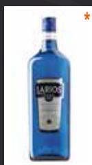
LARIOS 12 7,50 €