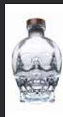
CRYSTAL HEAD 12,00 €