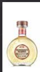
BURROUGH'S RESERVE 15,00 €