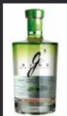
G'VINE FLORAISON 12,50 €