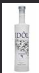
IDÔL BOURGOGNE 11,00 €

40% POLONIA Proviene de la mezcla de tres ingredientes distintos: la patata que le confiere riqueza y cuerpo, el trigo que le da suavidad y el centeno, que ofrece el sabor y la complejidad. El proceso de destilación se realiza con sofisticados filtros de cerámica y una última filtración en arcilla. Sabor a cereza, piruleta. Delicioso regusto en el paladar