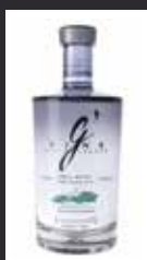
G'VINE (NOUAISSON) 12,00 €