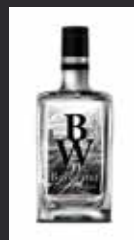
BAYSWATER 11,00 €