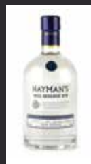
HAYMAN'S 1850 RESERVE 11,00 €