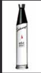
STOLICHNAYA ELIT 11,00 €