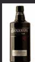
BROCKMAN'S 13,00 €