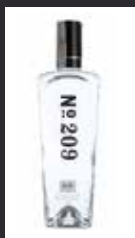
Nº 209 12,00 €