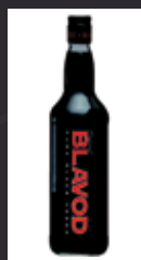
BLAVOD 7,50 €

40% POLONIA Este vodka procede del siglo XVIII, cuando los vodkas se destilaban en monasterios y en las propias casas. Caracterizado por su textura suave y su sabor con notas especiadas. La botella ha sido ideada por Frank Gehry.