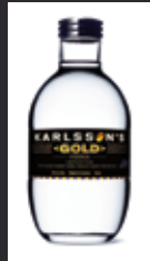
KARLSSON'S 10,00 €