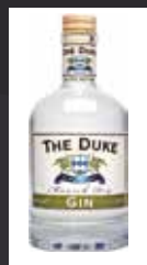
THE DUKE 11,50 €